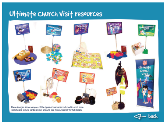
Das Unterrichtsmaterial besteht aus Stundenplänen, Unterrichtsmodulen, Büchern, Postern, CD ROMs, DVDs und Materialpaketen für die Schüler.

“Ich folgte den Anleitungen im Handbuch, sah mir kostenlose Online-Ressourcen an und lernte, wie das geht.”